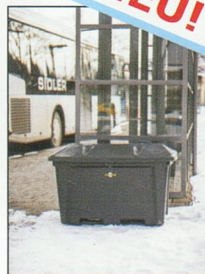
In Anthrazit zur Bereit-stellung von Salz für Büro, Industrie, Stadt - Variante City