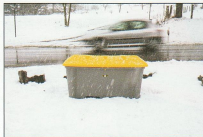
Zur Bereitstellung von Salz am Straßenrand - Variante Traffic