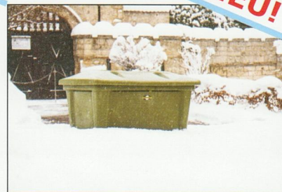
In Grün für Grünanlagen, Parks, oder Friedhöfe - Variante Park